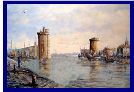
Port de La Rochelle